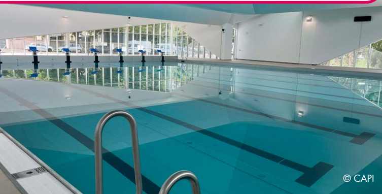
| Piscine intercommunale Alice Milliat à Bourgoin-Jallieu

Pour en savoir plus sur ce projet, cliquez ici ( https://capi-agglo.fr/nos-grands-projets/la-future-piscine-capi/ )